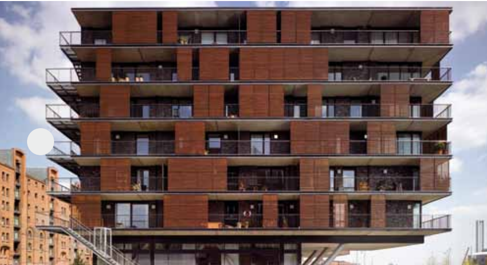
Sandtorkai 56 – Yksi kahdeksasta rakennuksesta