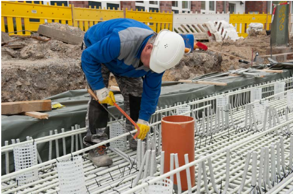
ComBAR-Bewehrungsstäben werden mit der Handsäge zugeschnitten.