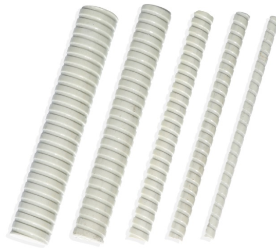
Glasfaserbewehrung Schöck ComBAR. Foto: Schöck Bauteile GmbH, Abdruck honorarfrei.