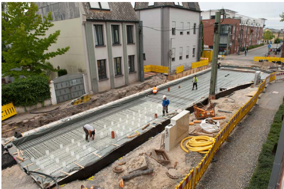
Bei einer Weichenanlage der StadtBahn Bielefeld wird auf zwölf Metern Glasfaserbewehrung verbaut.