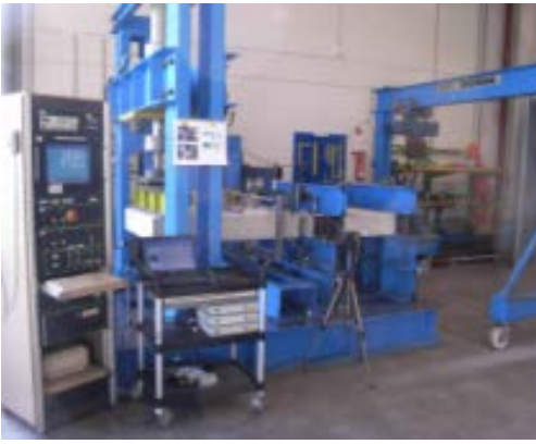
Simulatore sismico utilizzato per le prove di laboratorio sul giunto Isokorb®