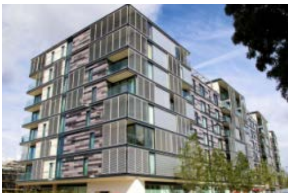
Isokorb® è un giunto isolante utilizzato per il taglio termico dei balconi e degli altri elementi a sbalzo delle facciate

sotto tutti i punti di vista, anche sismico. Allo studio del Politecnico di Milano si affianca un'importante attestazione, ossia la certificazione di idoneità tecnica all'impiego (CIT) ottenuta da Schöck Isokorb® come prima azienda in assoluto in Italia. Il CIT, rilasciato dal Servizio Tecnico Centrale del Consiglio Superiore dei Lavori Pubblici ai sensi del punto 11.1 lett. C) del DM 14.1.2008, differenzia il prodotto Isokorb® per qualità e soprattutto per sicurezza dalla concorrenza. Di fatti, la certificazione dimostra che all'interno dello stabilimento di produzione è operante un efficiente sistema di controllo della produzione e dichiara Isokorb® assolutamente sicuro e affidabile dal punto di vista strutturale.