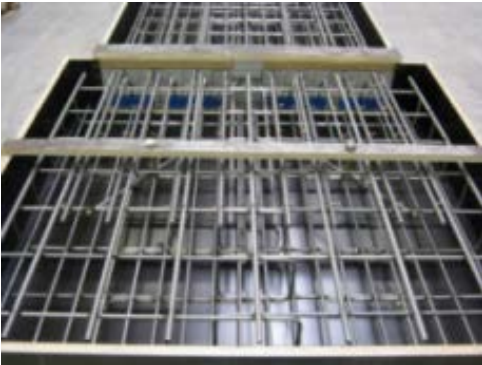
Il provino Isokorb®, prima del getto di calcestruzzo, utilizzato per i test