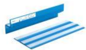
Schöck Tronsole F