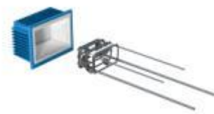
Schöck Tronsole Z