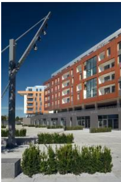
Osiedle BRABANK

Śniadanie na tarasie z widokiem na spokojnie kołyszące się na rzece łódzie – chyba większość z nas marzy o takich porankach. Wybierając mieszkanie, bardzo ważna – o ile nie najważniejsza – jest właściwa lokalizacja. Jedni cenią sobie spokój, inni chcą być w centrum wydarzeń kulturalnych, a jeszcze innym zależy na bliskim sąsiedztwie szkół i całej infrastruktury miasta. Najlepsze miejsce do zamieszkania to takie, które łączy wszystkie te cechy tak, jak w przypadku inwestycji BRABANK w Gdańsku.