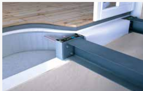
Beton - Stål tilslutning: Isokorb® type RKS