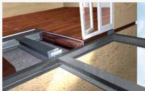
Stål - Stål tilslutning: Isokorb® type KST