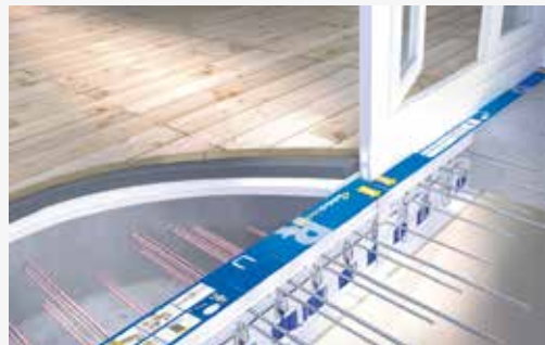
Beton - Beton tilslutning: Isokorb® type RK